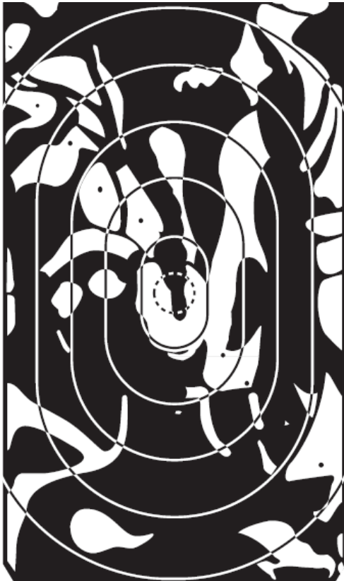
Police Pistol 1-Scheibe

Diese Scheibe wird auch für die Bewerbe Super Magnum (B. 3) und Super Magnum Optical Sight (B. 4) verwendet.